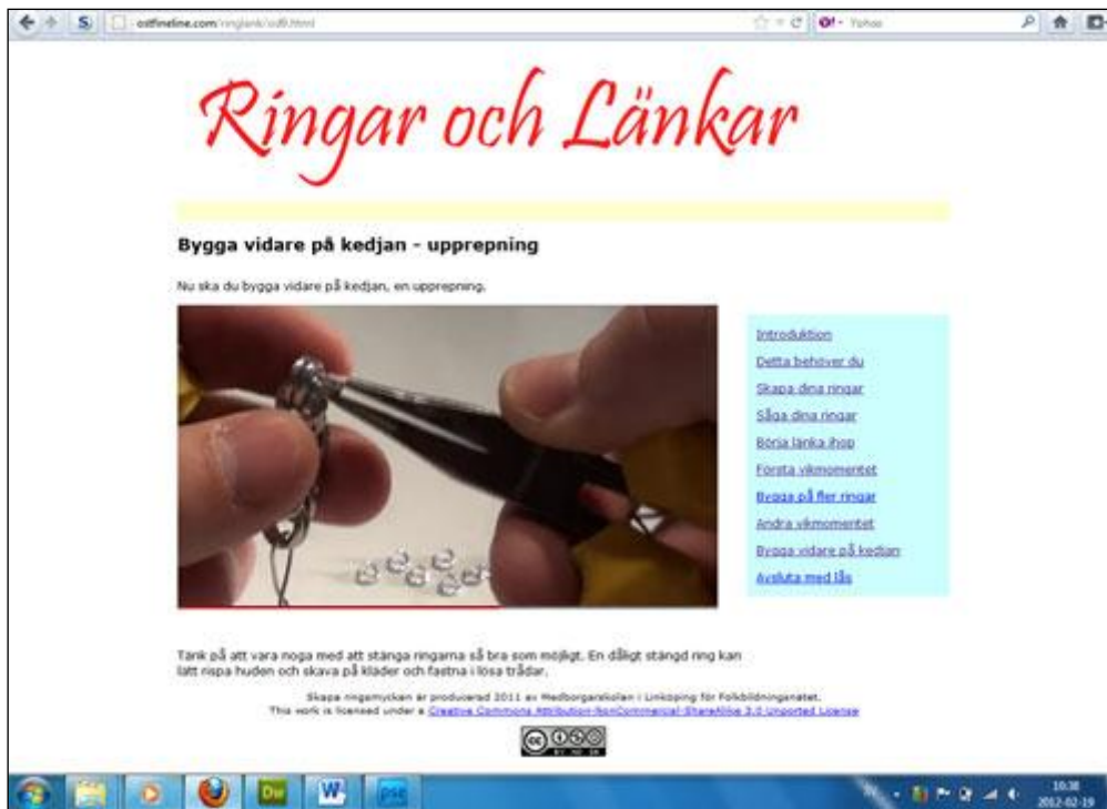
Skärmdump från hemsidan

I de slutliga kontakterna med Folkbildningsrådet fick vi en hel del påpekanden över sådant som de tyckte vi skulle ändra på och de sista veckorna var väldigt intensiva och mängder med små detaljer som vi missat åtgärdades, t.ex. märkningen av Creative Commons-rättigheter