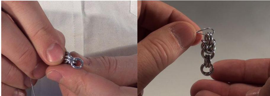
Filmat från olika vinklar

Nu infann sig sommaruppehållet och eftersom vi var anställda på visstid så gick vi hem och hade faktiskt ingen klar uppfattning om vi skulle bli anställda igen under hösten, detta innebar att arbetet med projektet låg nere under hela sommaren och vi tappade två och halv månad.