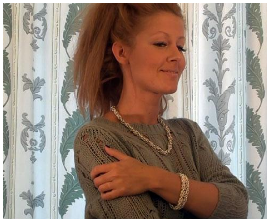
Vår kollega som vågade ställa upp som modell

Arbetet med lägga upp materialet på en hemsida tog sin början på allvar och vi testade flera olika layouter, men efter att ha fått feedback från olika referenspersoner så valde vi den nuvarande eftersom den är enkel, tydlig och har väldigt få komponenter som kan strula i olika webbläsare